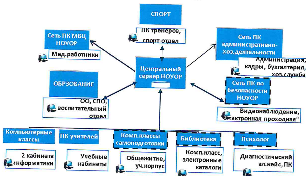
СХЕМА локальной сети НОУОР

В настоящее время ведутся работы по дальнейшему развитию единой общеучилищной локальной сети, которая позволит осуществить связь между учебным, спортивным корпусом, медико-восстановительным центром и общежитием Училища. Планируется установка 2-х компьютерных классов для самоподготовки обучающихся (в библиотеке, в общежитии НОУОР).